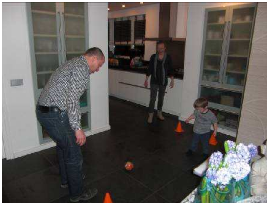
Het voetballen zit er al op jonge leeftijd in!