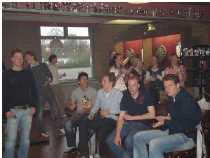
De belangstelling was groot