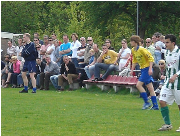
Het publiek is in groten getale op deze wedstrijd afgekomen, maar wordt nauwelijks verwend. Het heerlijke voorjaarszonnetje vergoedt veel.