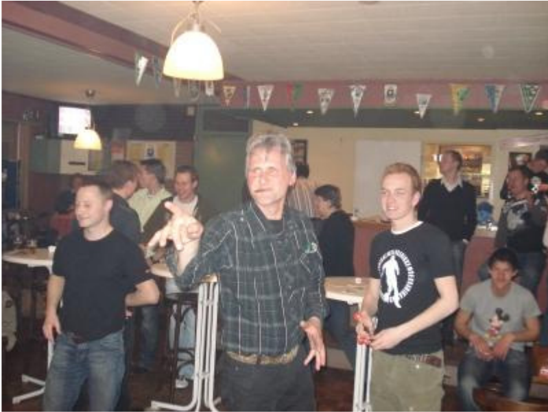
Onderwijzer tegen leerling