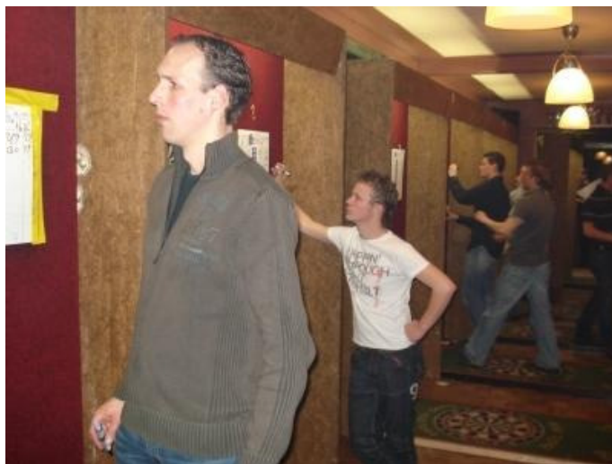
Geconcentreerd werd er geworpen