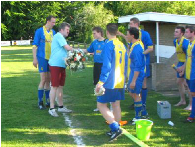
De welgemeende handdrukken, ook van de spelersgroep, ...